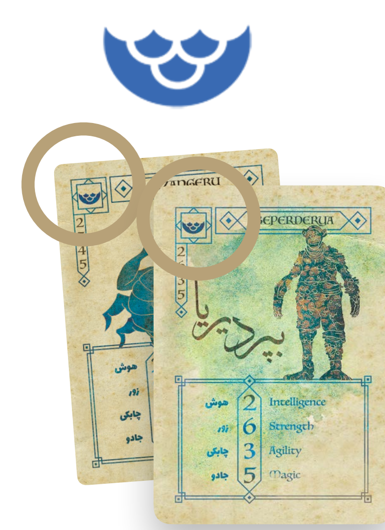
Matching the Class گروه مشابه

If the first player does not have a card that matches the Class or does not have a Supreme Card, they should draw one card from the deck. If the card that was picked fits the Class in question, they can place it immediately, otherwise, it must be added to their hand. Their turn is over.