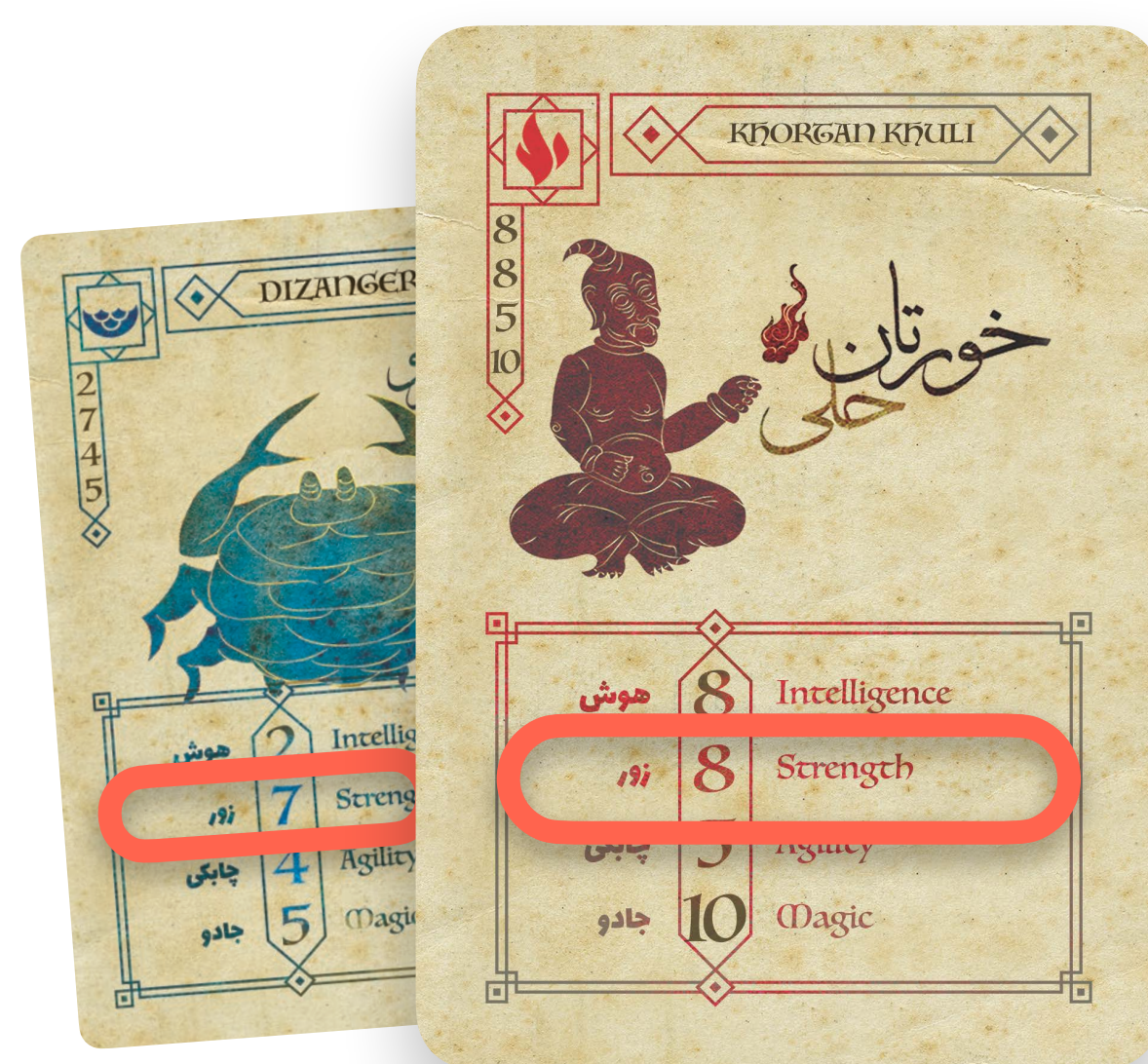
در مهارت انتخاب شده، امتیاز برابر یا بیشتر دارد